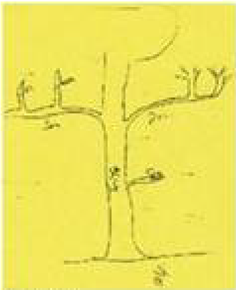
AGE: 41 SEX: M EDUCATION: 10