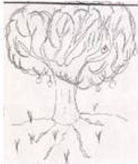
EDAD: 28 SEXO: F EDUCACION: Univ.